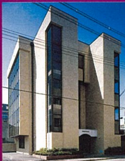
社団法人 京都獣医畜産連合会

京都市下京区西七条掛越町05 (西大路花屋町東入口) 電話 (075) 314-5707